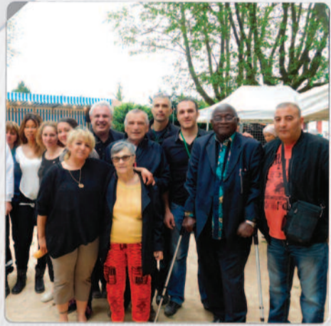
22 mai La Rize