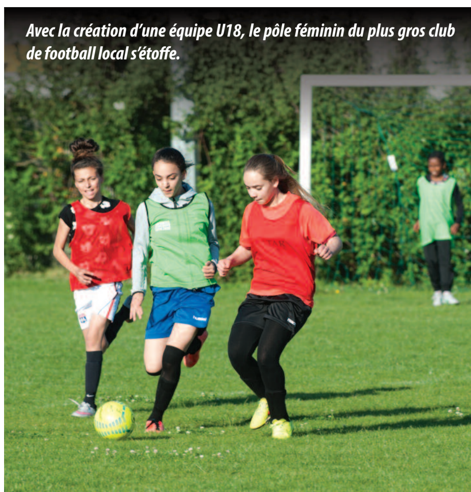
Avec la création d'une équipe U18, le pôle féminin du plus gros club de football local s'étoffe.

"Notre objectif reste de créer un effectif solide qui permettrait, à terme, d'arriver en Ligue, reprend la responsable de section. Certaines de nos filles ont été contactées par des grandes formations régionales comme Nivolas et même l'Olympique Lyonnais". Tout semble