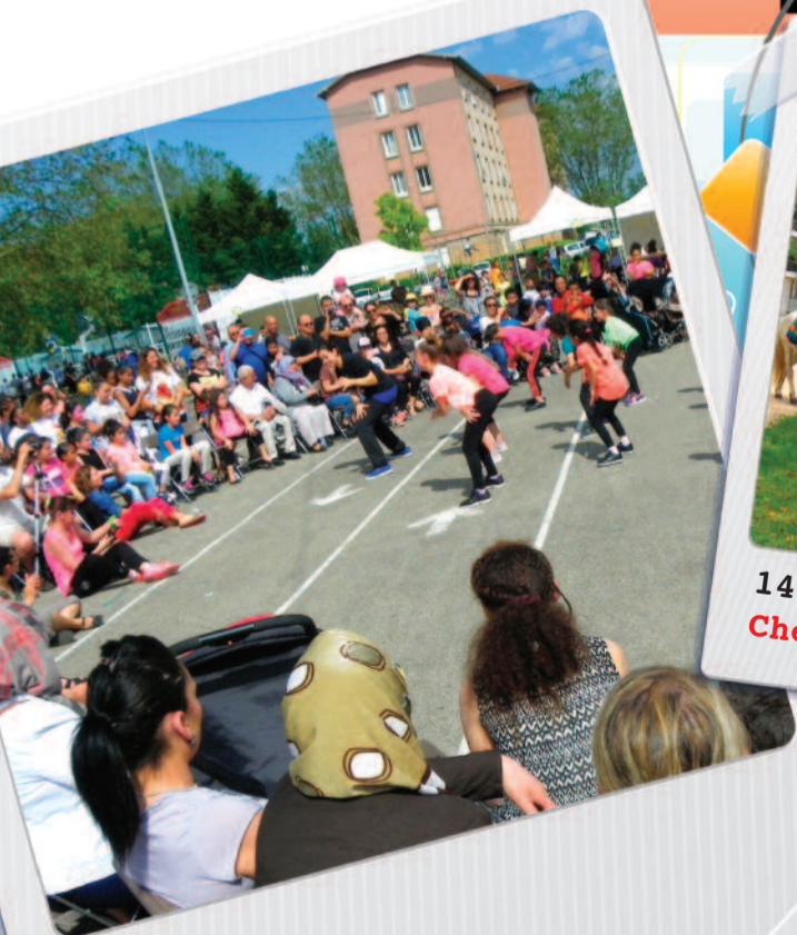
28 mai La Tase (Sud)