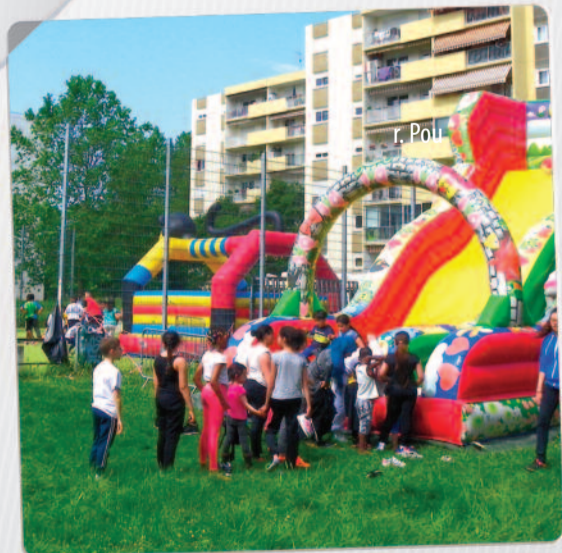
28 mai Sauveteurs-Cervelière