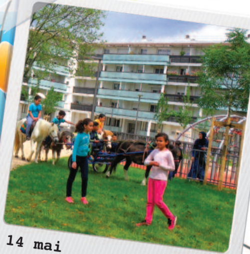
14 mai Chénier (Sud)