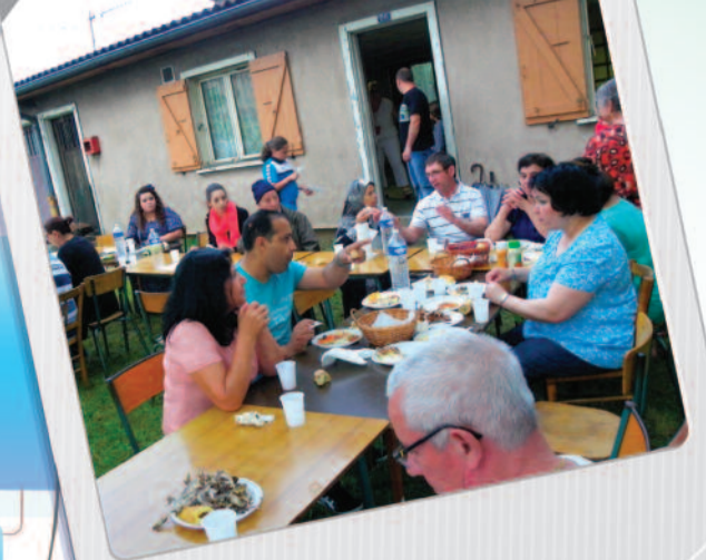
28 mai Marhaba (Sud)