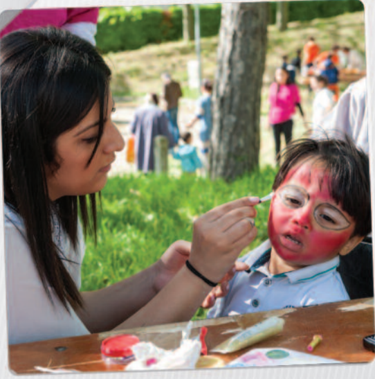
20 mai Mas du taureau