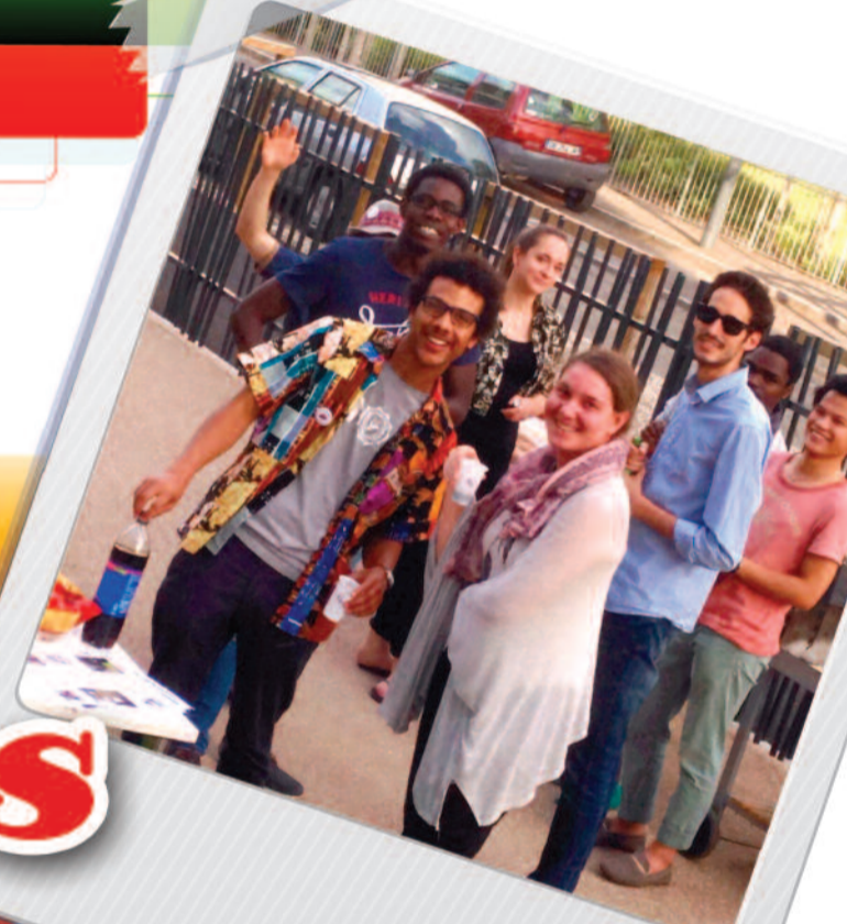
28 mai Centre-Ville